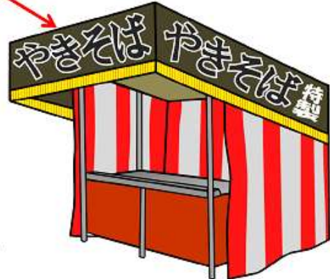
屋台用テント+紅白幕